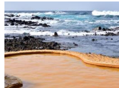
不老不死温泉・海辺の露天風呂

2 ホテル → 日和山 → 夕日海岸 → 見入山観音堂 → 银杏神社 → 石上神社と語部集落(語部帯川一族の郷) → 亀ヶ岡 → 世界文化遺産「田小屋貝塚」 → 高山稲荷 → 往古之木嶺 → 阿闍羅(あじやら)川口 → 三吉山 → 浜明神(昼食) → 中の島・歴史民俗資料館 → うまの浜(比羅夫と北ワケグラ王が和解の宴会をした浜) → 神明宮(安倍神社=オセドウ塚=御世頭陵) → 安倍神社 → 昆布掛邑(語部宮川家の郷) → 豊富町=紅毛崎(語部鈴木家の郷) → 宝森(大型安東船の造船所) → 金木の藤枝(語部金田一家の郷) → 中派立(なかはだち=語部大丸屋の郷) → 稲垣温泉(宿泊)