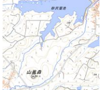
砂沢遺跡と山風の森

1 羽田空港 9:50発 → 青森空港 11:05着 → 古代の聖地「山風森の男神・女神」 → 砂沢遺跡 → 石上遺跡 → 天皇山 → 高倉神社 → 深浦:不老不死温泉(宿泊)