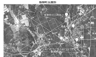
板柳町・ヒミカの関係遺跡